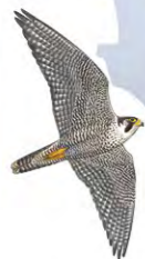
Faucon pèlerin Espèce commune