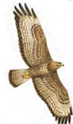
Buse variable Espèce commune