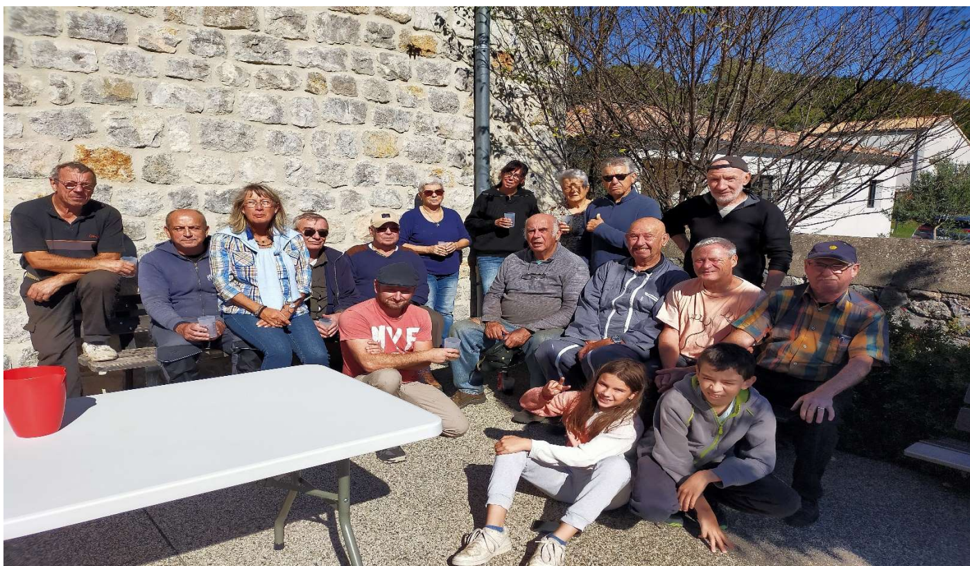
Un grand merci à l'équipe de bénévoles qui s'est démenée pour débroussailler un chemin en octobre dernier.