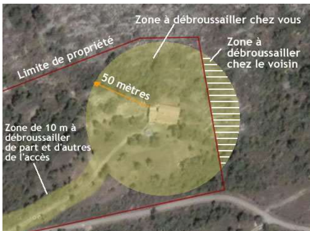
Schéma des dimensions de terrains à débroussailler :

Dans le cas où les services compétents constatent la défaillance du propriétaire face à ces obligations, il lui est adressé un avertissement écrit. Si dans un délai de deux mois, rien n'a changé, un procès-verbal peut être dressé et la commune peut pourvoir d'office aux travaux nécessaires au respect de cette loi et en faire supporter les charges au propriétaire concerné.