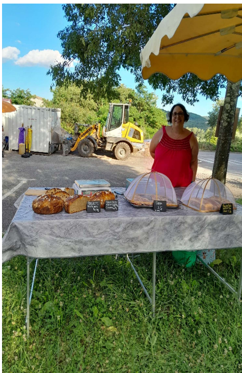
Pains spéciaux et viennoiseries