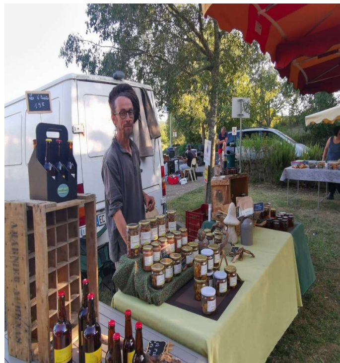
Miel, crème de marron et bières artisanales