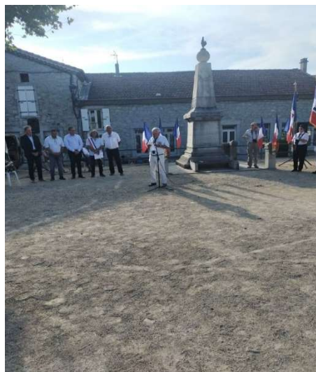
Le 29 août à Ruoms, commémoration de la libération.