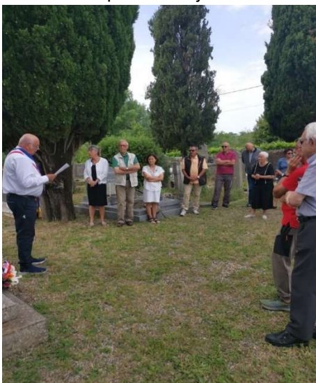
Le 6 juin au Monument aux Morts de Chauzon