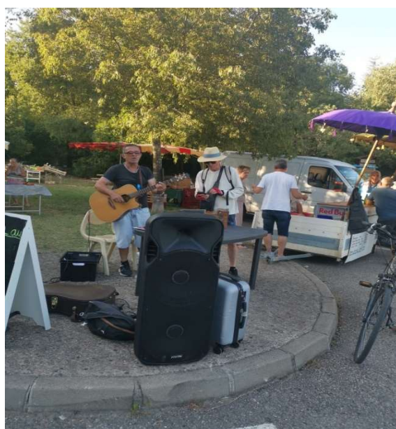
Le tout en musique