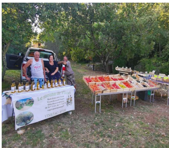
Huile d'olive, fruits et légumes